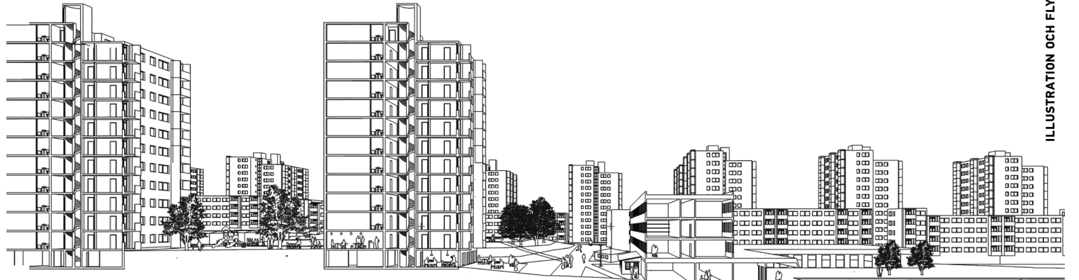
ILLUSTRATION OCH FLYGFOTO SPRIDD ARKITEKTER